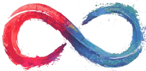
Figura 1: Feedback dos alunos

A utilização de Tecnologias Digitais ( como a plataforma Canva na realização de PDFs/Ebook e slides de aula) ajudaram a melhorar as aulas de Educação física nesse período?